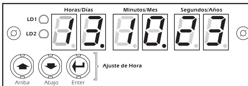
Frontal del Módulo

AJUSTE DE LA HORA. Antes de iniciar el funcionamiento del módulo deberá ajustar la hora. Para ello, mantenga apretada la tecla Enter, situada en el frontal del módulo, hasta que el led LD1 comience a parpadear. Seguidamente, los dos displays de los minutos y segundos comenzarán a parpadear, quedando fijos los de las horas. Siempre que acceda al ajuste del reloj, los displays que queden fijos corresponderán a los que podrá regular, mientras que los que parpadeen permanecerán en espera. En primer lugar podrá ajustar los displays de las horas. Pulsando sobre las teclas Up o Down aumentará o disminuirá su cifra. Si mantiene cualquiera de estas dos teclas apretadas durante más de un segundo, el aumento o disminución se realizará a mayor velocidad.